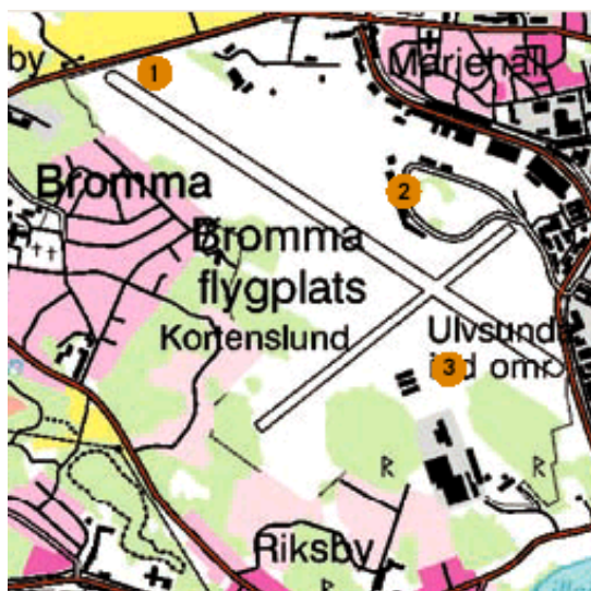
Figur 1 Mätpunkter för luftföroreningar på Stockholm-Bromma Airport. 1=Kvarnberget, 2=Terminal 1, 3=Lintaverken